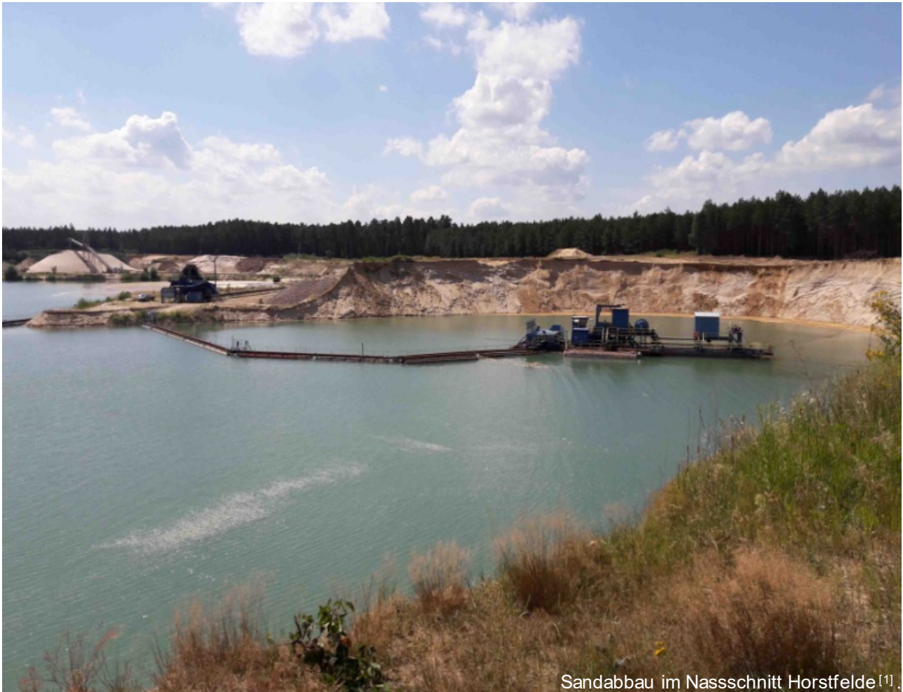
Sandabbau im Nassschnitt Horstfelde [1] .